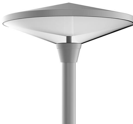
Föreslagen armatur för belysningsstolpar på parkering

Andra aktiviteter av underhållskaraktär kan uppstå under året och hanteras vid behov.