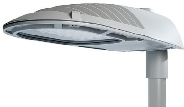
Föreslagen armatur för belysningsstolpar inne i vårt område

83 000kr + 15% oförutsett = ca 95 000kr.